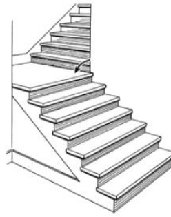
Subida y bajada ala derecha